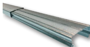
Rallonge Optima 50