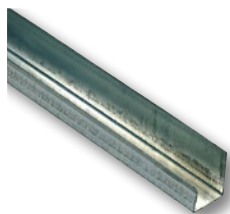
Fourrure Optima U ST